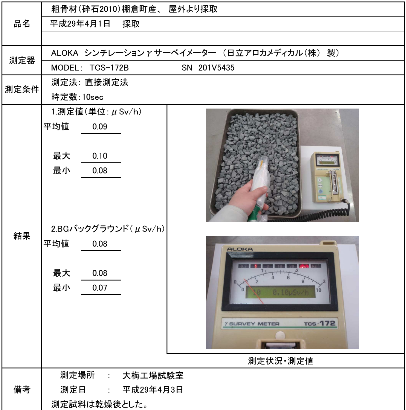
測定状況・測定値