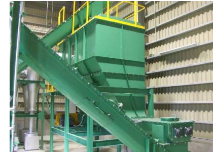
⑤ 成形機定量供給機