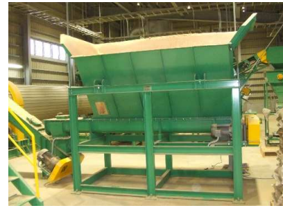
① 乾燥機定量供給機