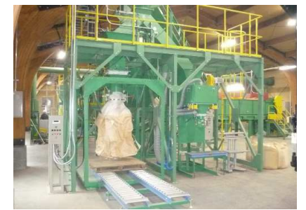
⑨⑩ フレコン、小袋詰め装置